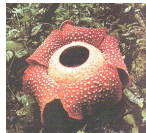
Тропическое растение — Раффлезия.

Размах ее лепестков достигает 1 м в диаметре! Раффлезия—тропическая жительница, растет она на Филиппинских островах и в Индонезии. И, между прочем, цветет не больше двух дней. У нее нет ни корней, ни стеблей, ни листьев. Раффлезия скорее напоминает громадный мухомор без ножки, выросший на корнях и ветках лиан.